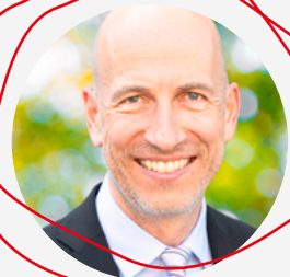
Univ.-Prof. Dr. Martin Kocher Bundesminister für Arbeit und Wirtschaft

Ich freue mich, dass wir mit unserer Kreativwirtschaftsstrategie für Österreich dazu beitragen können, Innovation und Transformation in der gesamten österreichischen Wirtschaft voranzutreiben!