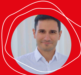
Branko Markovic influence.vision GmbH www.influencevision.com