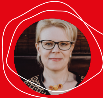
Heidrun Girz Heidrun Girz Consult e.U. www.more-innovation.at