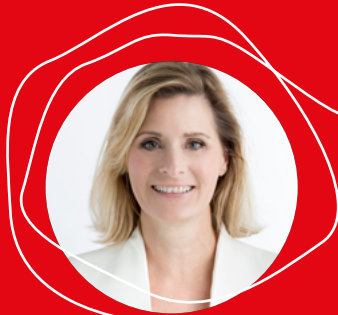
Sabrina Oswald Futura GmbH www.futura-comm.at