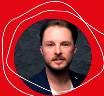
Manuel Zellnig Maze & Friends www.mazenfriends.agency